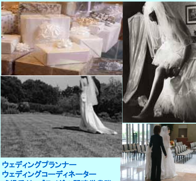
ウェディングプランナー ウェディングコーディネーター 式場受付 ブライダル関連営業職