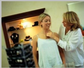
ファッションアドバイザー