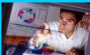
クリエイティブディレクター